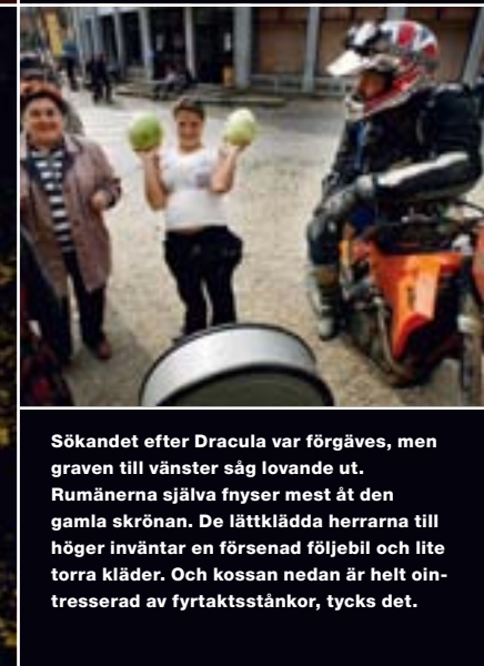
Sökandet efter Dracula var förgäves, men graven till vänster såg lovande ut. Rumänerna själva fnyser mest åt den gamla skrönan. De lättklädda herrarna till höger inväntar en försenad följebil och lite torra kläder. Och kossan nedan är helt ointresserad av fyrtaktsstänkor, tycks det.